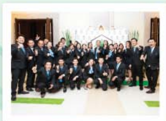
โบหน้าอันยิ้มแย้มแจ่มใส ตีใจและภูมิใจของพนักงานที่ได้ร่วมกันจัดงานการประชุมในครั้งนี้