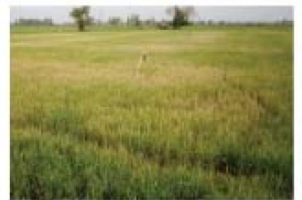
การระบาดของหนอนปลอกที่อุตรดิตถ์