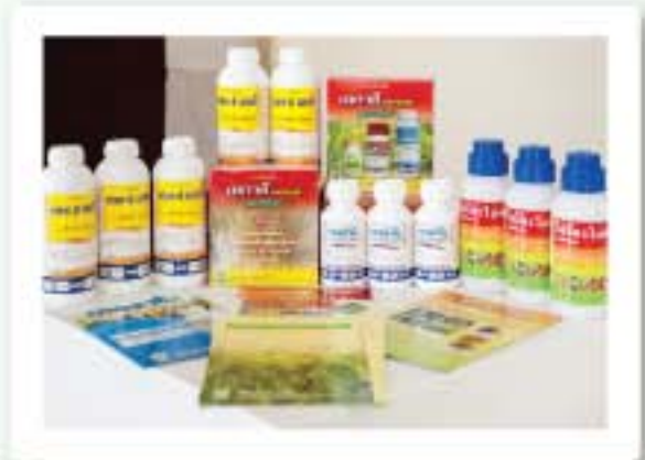
จัดแสดงกลุ่มผลิตภัณฑ์ที่สำคัญตามชนิดพืชที่มีความสำคัญทางเศรษฐกิจ