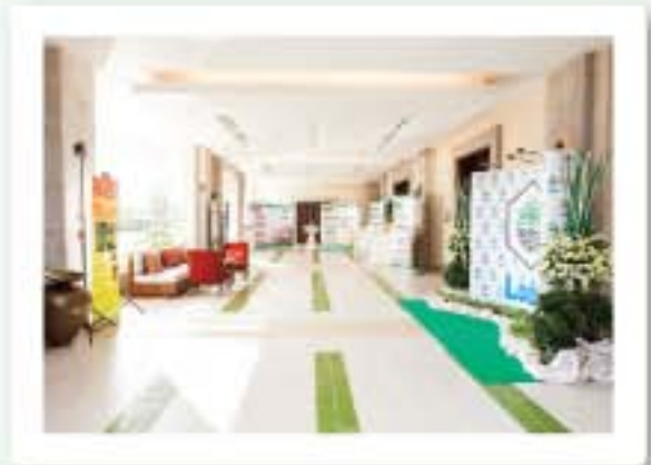
ประกาศวิสัยทัศน์และจัดนิทรรศการ บริเวณหน้าห้องประชุม