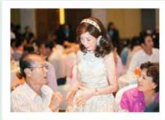
มอบบัตรกำนัลสำหรับผู้มีอายุจำหน่ายสุราในปี พ.ศ. 2555 และหักภาษีมูลค่าเพิ่มที่มาร่วมงาน