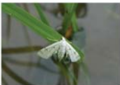
ผีเสื้อของหนอนปลอก

หนอนปลอกเกิดจากแมลงตัวเต็มวัยที่เป็นผีเสื้อขนาดเล็กไปวางไข่บนต้นข้าว ไข่ของผีเสื้อที่ฟักออกเป็นตัวหนอนจะกัดปลายใบข้าวเอามาทำหุ้มตัว มีลักษณะเป็นปลอก (จึงเรียกว่า หนอนปลอก) ปลอกที่มีหนอนอยู่ภายในจะลอยอยู่บนผิวน้ำ เมื่อลมพัดให้ปลอกไปโดนต้นข้าว หนอนก็จะตีบคลานขึ้นไปกัดกินใบข้าว ทำให้ใบข้าวมีสีขาวคล้ายอาการถูกทำลายของหนอน ม้วนใบข้าว แต่ด้วยนิสัยของหนอนปลอกชอบอาศัยอยู่บนผิวน้ำ ระยะการระบาดจึงเกิดขึ้นหลังจากที่ชาวนาไถน้ำเข้านา เมื่อข้าวออกขึ้นเป็นต้นกล้าและอาจระบาดไปจนข้าวอายุถึง 1 เดือน ชาวนาต้องหมั่นสำรวจว่ามีผีเสื้อหนอนปลอกบินอยู่ทั่วไปในนาหรือไม่ ถ้าพบต้องรีบฉีดพ่นสารกำจัดแมลง การทดสอบของบริษัทฯ พบว่า สารฟิโพรนิล (fipronil) ชื่อการค้า " เกรท 5 เอสซี " อัตรา 100-120 ซีซี/ไร่ ให้ผลดีมาก