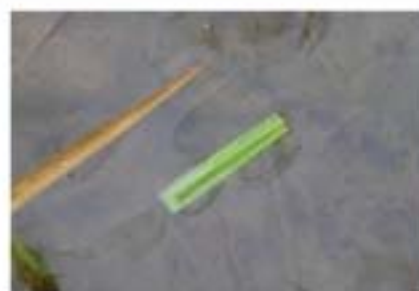
หนอนปลอกลอยบนผิวน้ำ