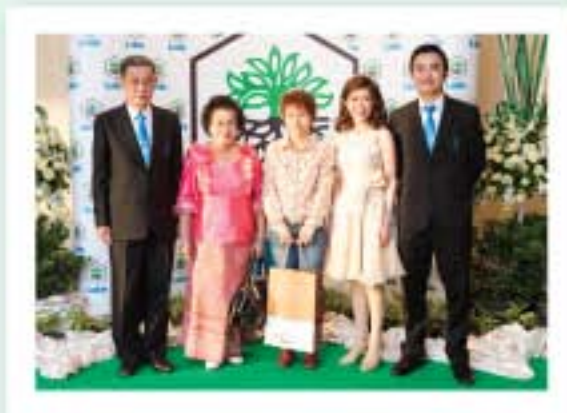
ร่วมถ่ายภาพเป็นที่ระลึกกับตัวแทนร้านค้าที่มาร่วมงาน